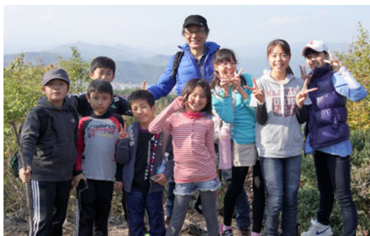
2013年11月 多峰主山・名栗川ハイキング