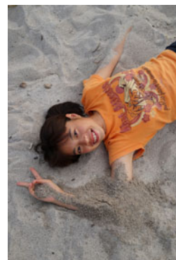
2013年 第38回 式根島キャンプ&ダイビング